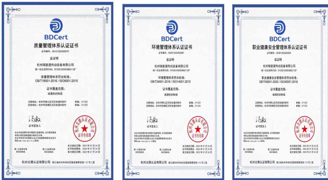
图表 4-1 公司证书扫描件

为保证产品质量满足顾客的要求和国家法律、法规，并确保环境管理符合国家法律、法规和其他要求并持续改进，本公司顺利通过并获得了 ISO9001 质量管理体系认证、ISO14001 环境管理体系认证、ISO45001 职业健康安全管理体系证书如下：